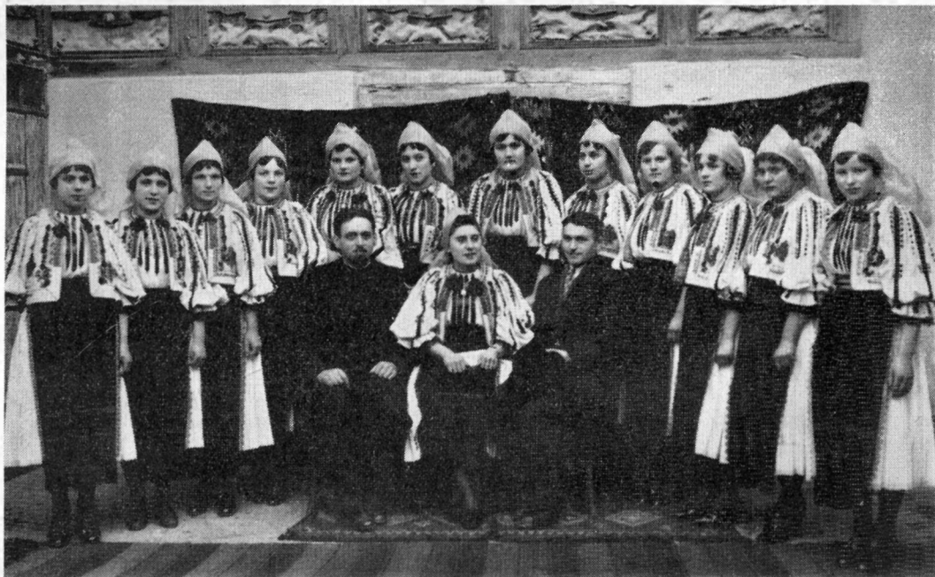
Școala țărănească din Tilișca (jud. Sibiu).