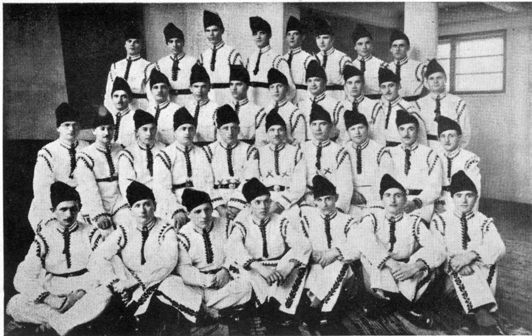
Corul „Șoimii Carpaților” din Câmpia-Turzii.