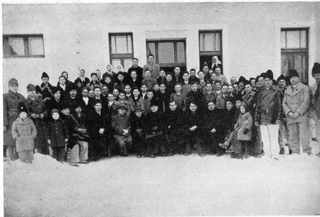
Școala țărănească din Iernut (jud. Târnava-Mică).