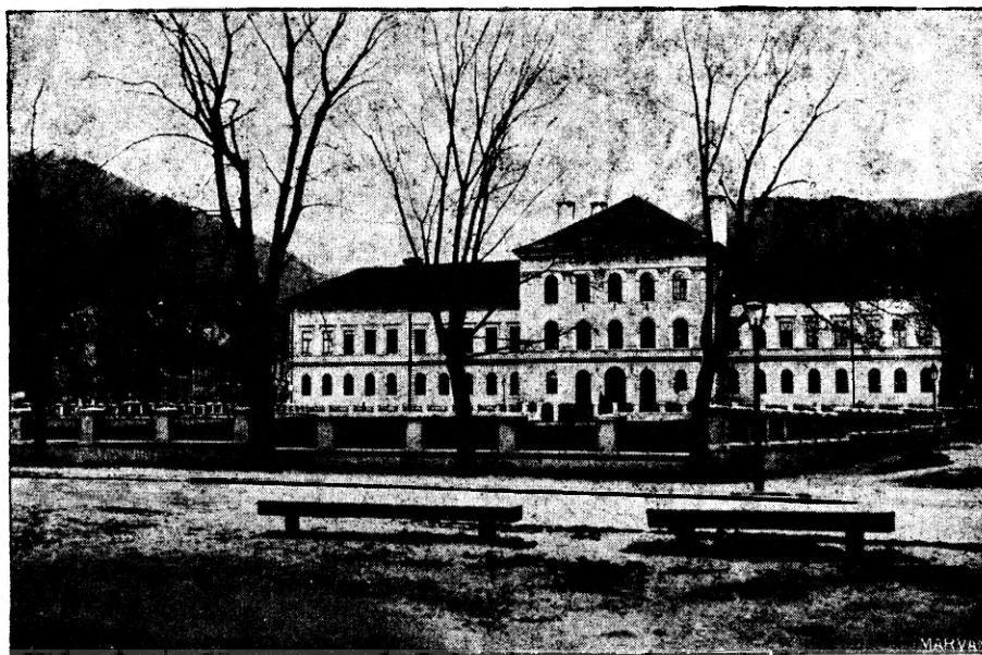
LICEUL „ANDREI ȘAGUNA”