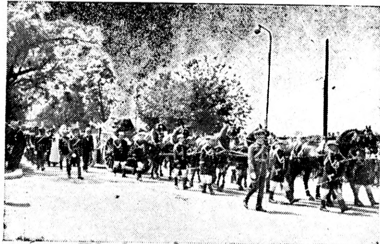
Corlegiul funebru cu rămășițele pământești ale Reginei Marie, pe ultimul drum la Curtea de Argeș.