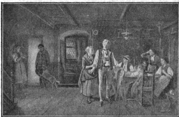
E. VAUFIER: FIUL CEL RĂTĂCIT.

R.: Tata stă în picioare, unde e locul mai luminat, fiul stă în întunerec.