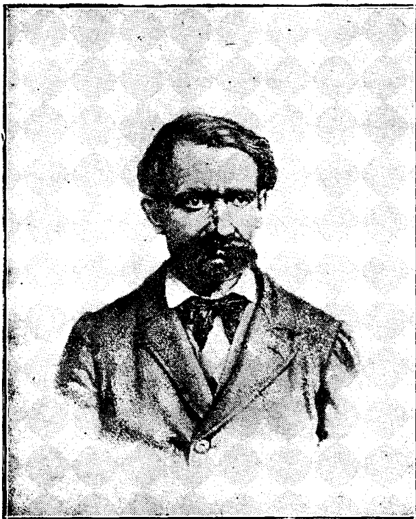
Avram Iancu în anul 1870.

trâna preoteasă după ea. Îmi spunea tatăl meu, că la fiecare popas mă-mă-sa trimitea oficerilor excortei câte un galbin, ca să mai ușureze soarta prizonierilor. Oficerii primeau bucuros banul, dar robii nu simțiau nici o schimbare în bine. Din Gherla, fiind goală și de bani și de alimente, bunica adânc măhnită trebuî în fine să se întoarcă acasă, iar tatăl și unchiul