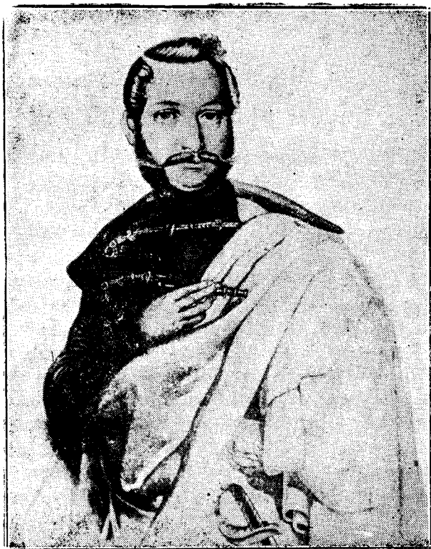
AVRAM IANCU după desemnul făcut de I. Costandea , Sibiu.

Adunarea (tinerilor din Târgu-Mureșului), după ce ascultă cu multă bucurie din graiul lui Birlea mișcările naționale din Blaj formă concludul următor că «pe Duminica Tomei după Paști toți tinerii câți se află în această mică adunare cu toți cunoscuții lor civili și preoți, intelectuali și țărani pe câți îi vor putea înduplecă să se afle în Blaj, unde aflându-se mai mulți