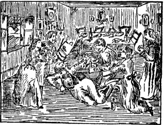
Groszbauer deschide ochii și șoptesce mai, încă mai!