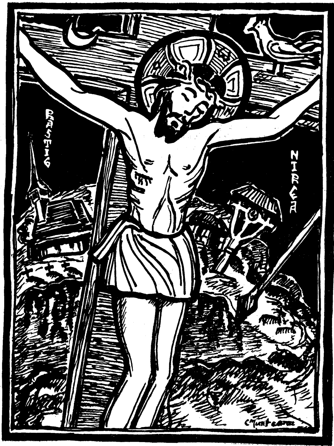
CORIOLAN MUNTEANU: ICOANĂ