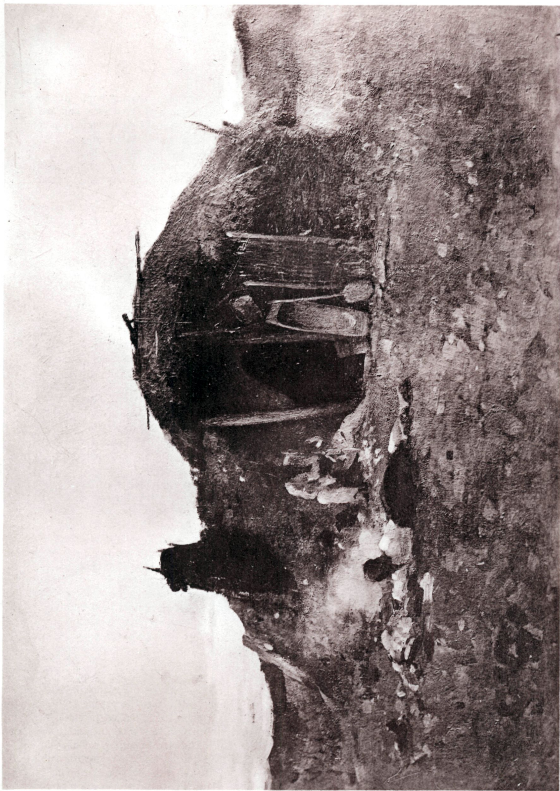
N. Grigorescu: Bordeiu figănesc. (Din colecția Carada).