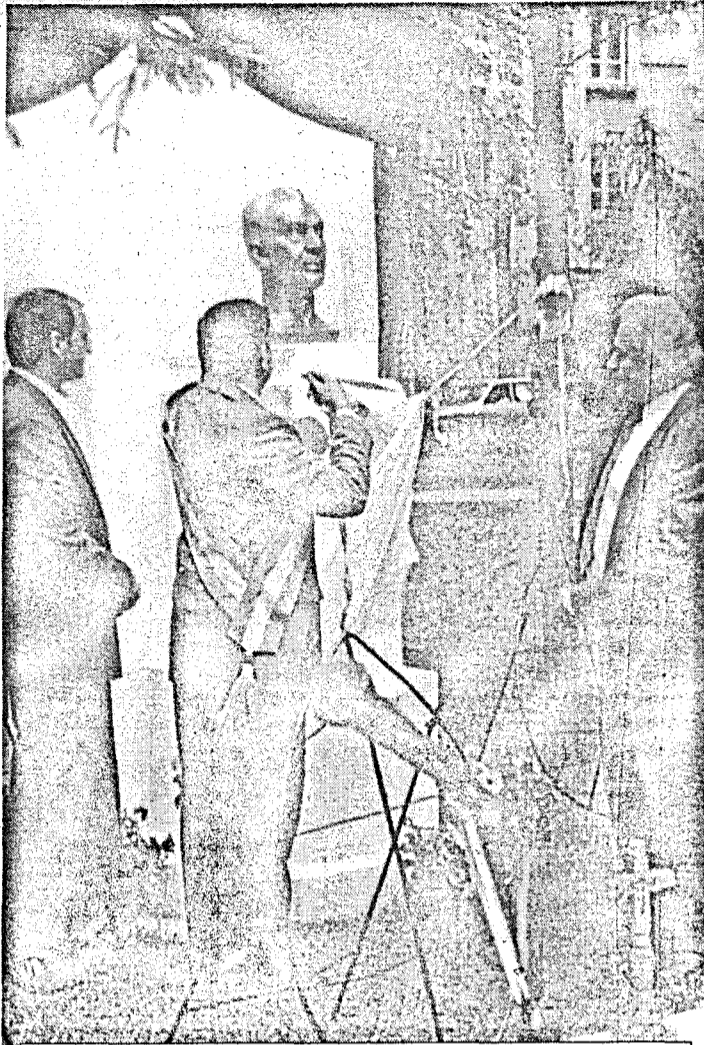
Momentul dezvelirii monumentului dedicat lui Sigismund Toduță.