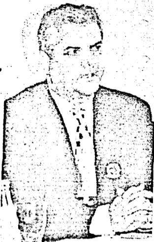
Prim-vicepreședintele PDSR Adrian Năstase a declarat, ieri, că Biroul Executiv Central al partidului a aprobat înscrierea

Adrian Severin susține că a avut o discuție cu membrii Biroului Executiv al partidului