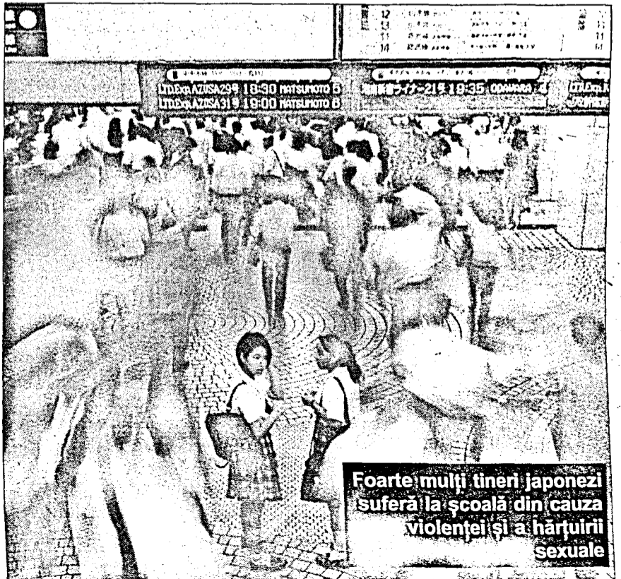
Foarte mulți tineri japonezi suferă la școală din cauza violenței și a hărțurii sexuale