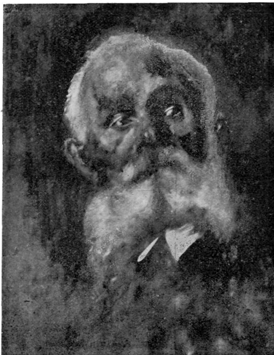
D. HÎRLESCU : Studiū.

— Să nu te miri, bade Ioane, — zise — dar să fiu hoț de-am mai mîncat așa puii de frig. — Acolo cu oile în vale e la adăpost . . . Da cînd ești pe măgură, măi tete, numai te pome-nești cu un vintuleț subțire, care te taie până la oase. Ce-î crivățul pe lingă el? Nu mi-am