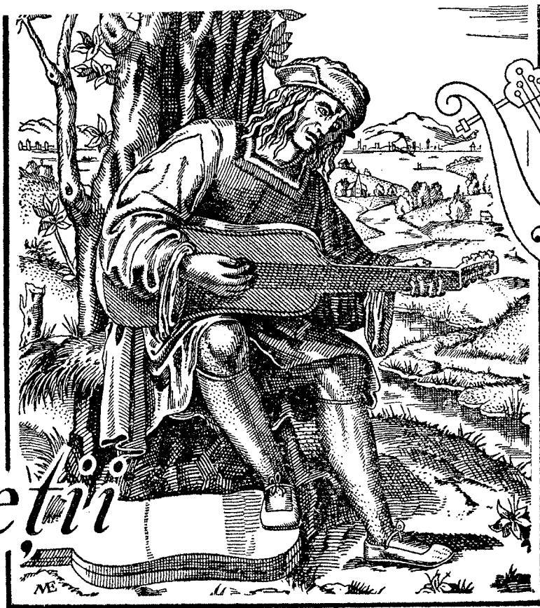
După o gravură din Secolul al XVI-lea a lui Marcantonio Raimondi.