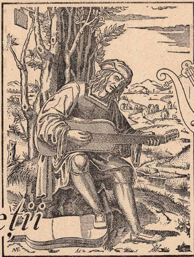
După o gravură din Secolul al XVI-lea a lui Marcantonio Raimondi.