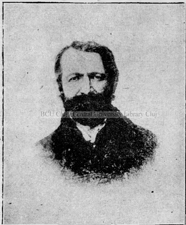
Avram Iancu in anul-1868.