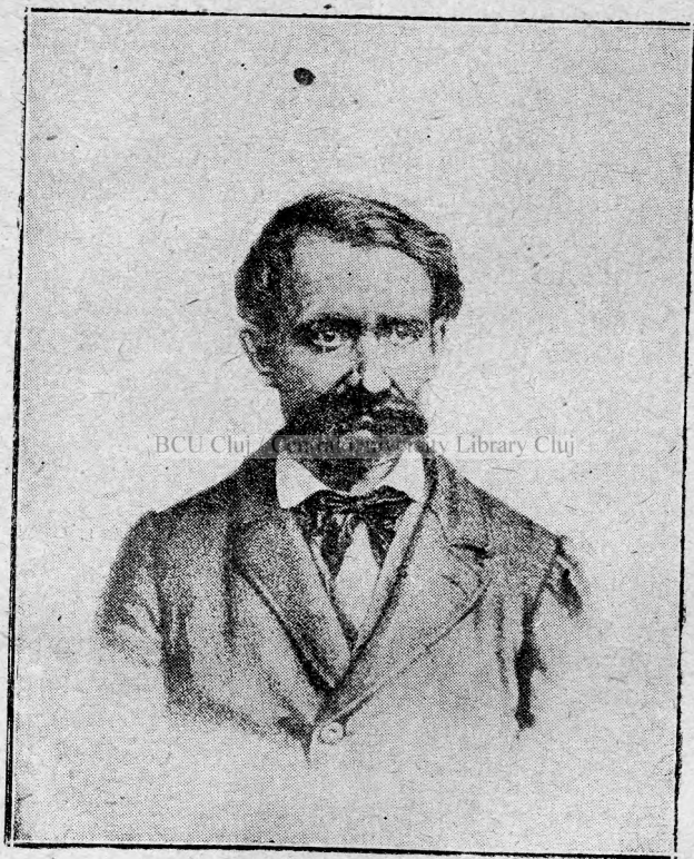
Avram Iancu în anul 1870.