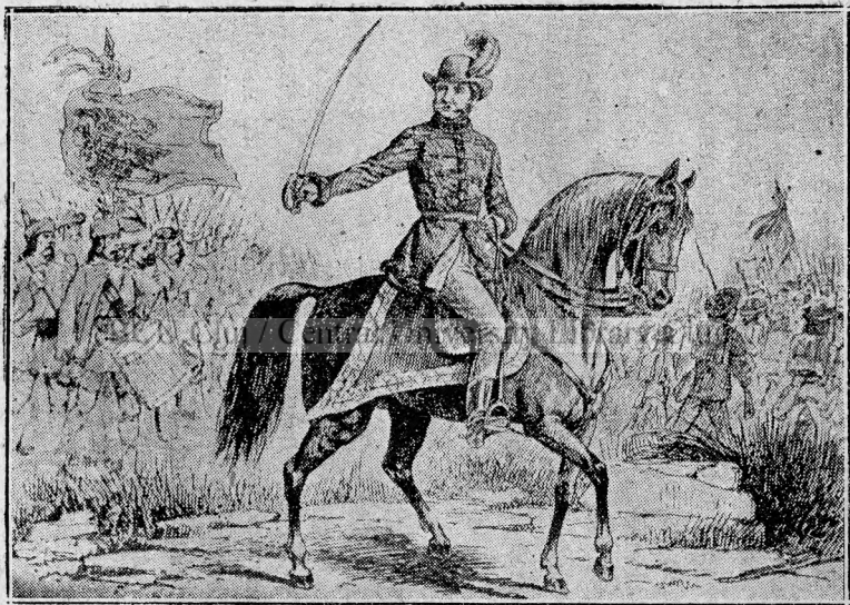
Avram Iancu călare, urmat de Moți.