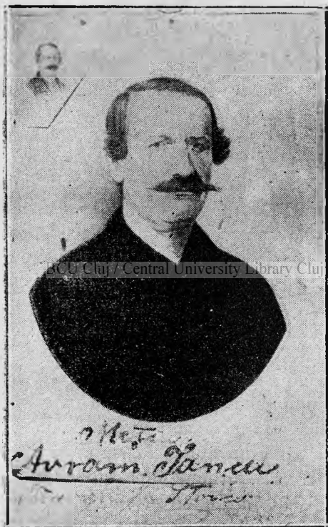
Avram Iancu in anul 1867.