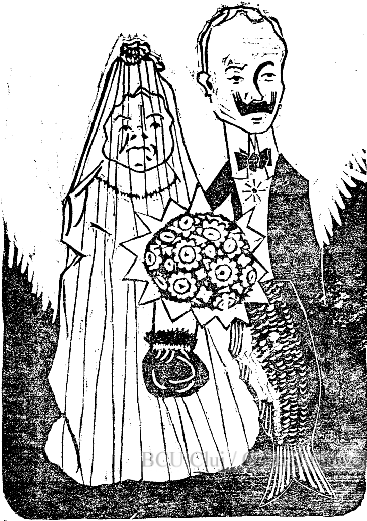
Cópii după natură