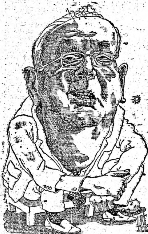
Senator JESSE HELMS Incoming Senate Foreign Relations Committee chairman

Masayoshi Takemura, ministrul japonez de finanțe (stinga) și senatorul american Jesse Helms, președintele comisiei senatoriale pentru probleme externe (dreapta) văzuți de IURIE