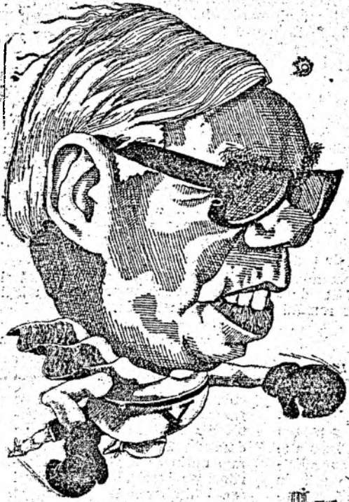
Japanese Finance Minister MASAYOSHI TAKEMURA

Masayoshi Takemura, ministrul japonez de finanțe (stinga) și senatorul american Jesse Helms, președintele comisiei senatoriale pentru probleme externe (dreapta) văzuți de IURIE