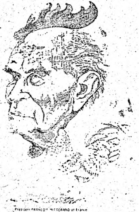
PRESIDENT FRANÇOIS MITTERRAND DE FRANCE