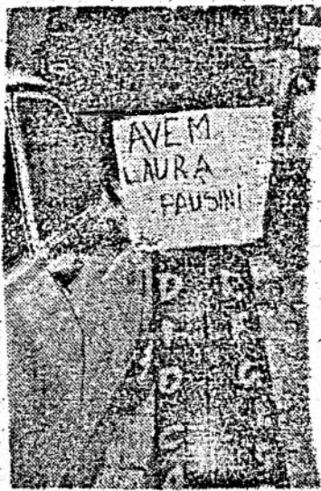
Reclama sau... „moartea” comerțului