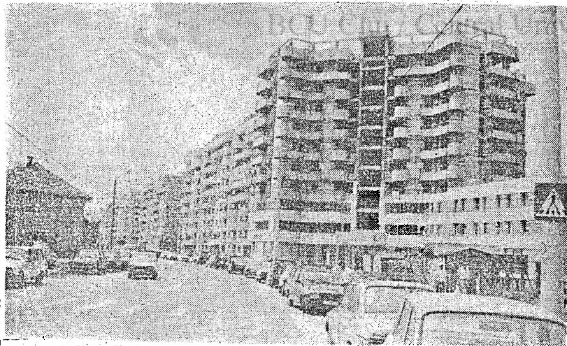
Noul și vechiul în urbanismul clujean, sau... cum se învechește un bloc înainte de a fi nou.