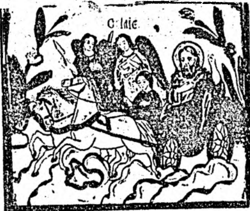
SFINTUL PROOROC ILIE TESVITEANUL

Stiri * Informații * Stiri * Informații * Stiri * Informații