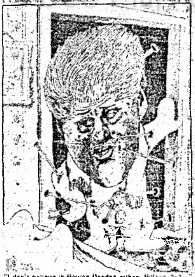
Hillary, nu cred în superstițiile haitiene dar ...

B. Clinton, primul lider american născut după cel de-al doilea război mondial, a fost atât de exuberant în sprijinul său față de Germania încît chiar și ziaristii germani au întrebat prudent dacă nu se simte puțin neliniștit la ideea că germanii vor pleca din nou în marș peste frontiere. „Am mare încredere în obiectivele mai largi și în politica acestei țări”, a spus B. Clinton la începutul vizitei sale. „Orice lucru care poate fi făcut pentru a-și da Germaniei posibilitatea să-și îndeplinească responsabilitățile de lider pe care este în mod clar capabilă a le îndeplini constituie un lucru pozitiv”, le-a spus el ziaristilor. Clinton a îndemnat Germania să trimită trupe pentru a lupta în misiuni ONU — asemenea celei din războiul din Golf.