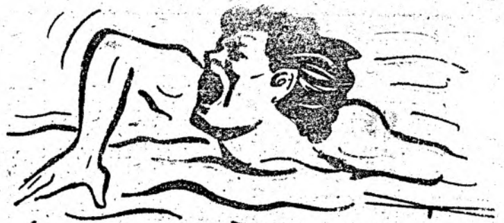
Mari sportivi ai lumii