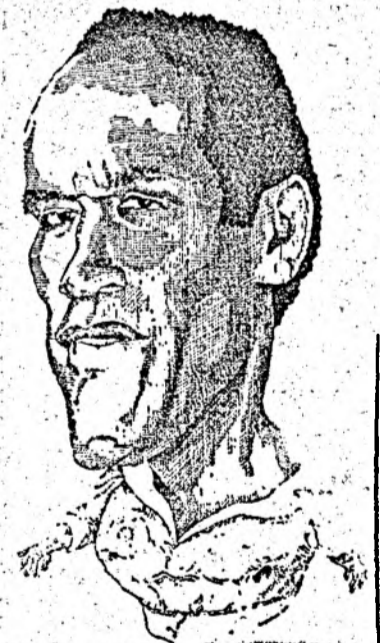
O.J. Simpson, celebrul jucător de fotbal american, arestat pentru uciderea soției și amantului acesteia.

Potrivit GAFI, „a fost depistat un număr important de exemple de bănci care cooperează prin obligațiunile la spălarea banilor cu infractori susceptibili de a prelucra controlul instituțiilor bancare și de a pătrunde și în alte instituții financiare”. În următoarele 12 luni, GAFI se va ocupa cu prioritate de următoarele țări: China, Taiwan, Coreea de Sud, India, Pakistan, Sri Lanka, Vietnam, Thailanda și Malaysia. În Europa va fi vorba de Rusia, Polonia, Ungaria, Republica Cehă. GAFI se va ocupa de asemenea de Mexic, Caraibe, Panama, Bahamas, Venezuela și de America de Sud — Columbia, Brazilia, Argentina, Ecuador. Președinția GAFI va fi asigurată de Olanda începînd din luna iulie, apoi de Statele Unite cu începere din iulie 1995.