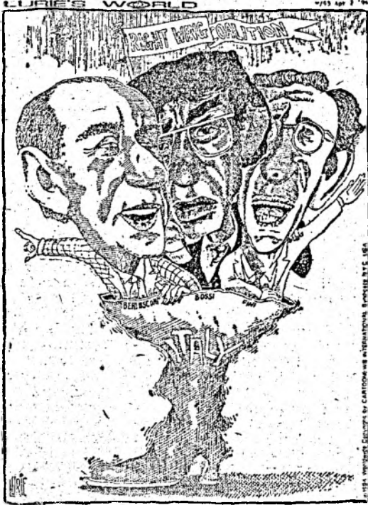
"Forward march, Italy!"

Opoziția nu ar avea deci posibilitatea de a se exprima în Parlament decât în timpul dezbaterii legilor, dacă majoritatea de dreapta ar evita tradiționalele și lentele comisii bilaterale (majoritate-opoziție) pentru a elabora reforme. Un fost președinte al Consiliului Constituțional, Ettore Gallo, nu a ezitat să vorbească de un fel de „lovitură de stat” a dreptei. Puterea discreționară pe care și-o atribuie a fost considerată de asemenea ex-