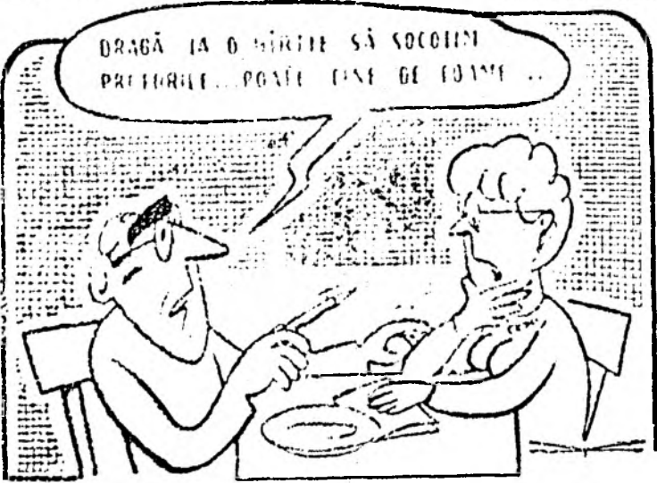
ÎN PAGINA A 4-A: NOILE PREȚURI LA CARNE