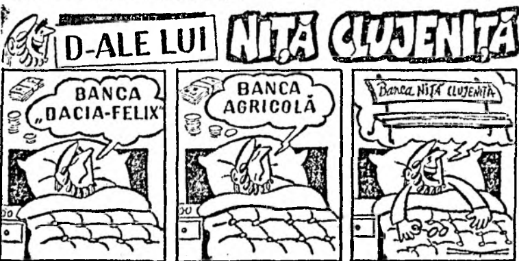
Desen de VIRGIL TOMULEȚ