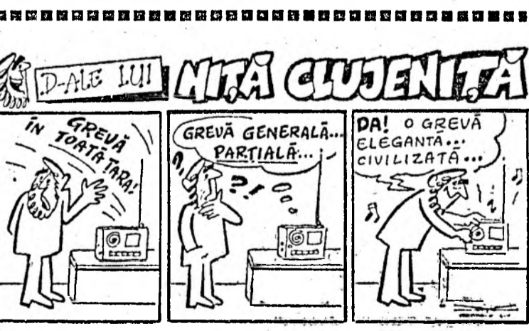
Desen de Virgil TOMULEȚ

ele au făcut obiect de speculă. Acum, în criza prin care tre- cem, se cere executivului, ca și în 1991 și 1992 să intervină pen- tru fixarea de salarii minime, sa- larii medii, compensații și inde- xări etc, obligatorii pentru a- genții economici. Nu înseamnă dirigism, intervenția statului? Deci, în privința veniturilor sa- lariale guvernul trebuie să in-