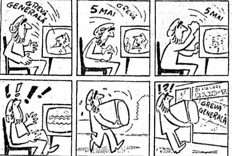
Desen de Virgil TOMULEȚ