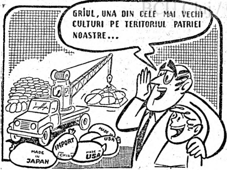
DESEN de V. TOMULEȚ

Am prezentat, cu cîva timp în urmă, impresii ale unor mame care frecventează Școala Familiei de la Dispensarul XXV din cartierul Dîmbul Rotund. Pentru a nu crea impresia că această școală este dedicată doar femeilor, lată acum cîteva puncte de vedere ale unor tați sau viitori tați care participă cu același interes la cursurile cunoscute și apreciate de acum atît în țară cît și în străinătate: