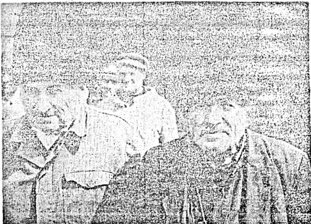
„De noi, pensionarii de la zona Cluj-Napoca, trebuie să se gîndească”

Nu ar fi păcat să se pară o asemenea inițiativă generoasă, din care, la urma urmei, tot pensionarii ar avea de câștigat?