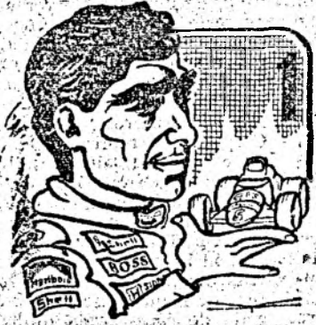
Desen de: Virgil TOMULET

Temerar al volanului, câștigător a nenumărate „Grand Prix”, urd de formula 1, este an de an antrenat în competițiile cu adăugare de puncte care stabilesc campionul absolut. Intre rivalii