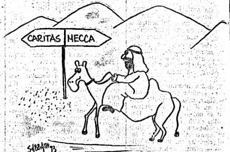
... in viziunea colaboratorului nostru TIBERIU SABO