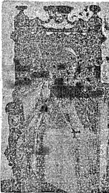
Papa Ioan Paul al II-lea

Ceea ce speră episcopul IRINEJ — este o renaștere a ortodoxiei mondiale, cu valorile și tradițiile ei perene. În cadrul căreia ortodoxia balcanică poate și trebuie să devină o forță de coeziune și progres.