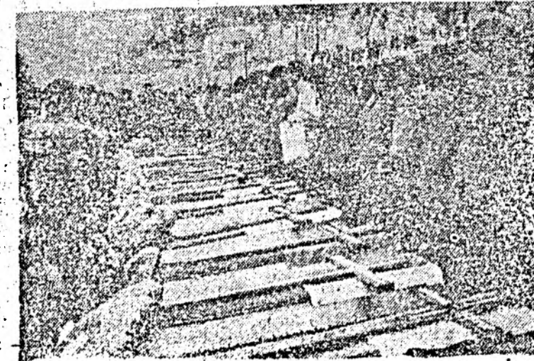
Oameni vii și oameni morți în fosta Iugoslavie.