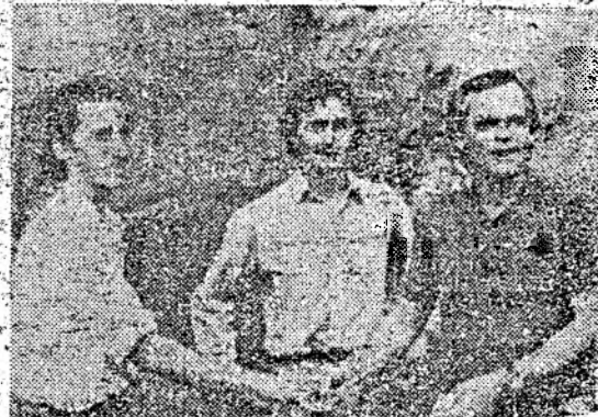
Cei doi studenți români primind felicitările primarului din Namur.