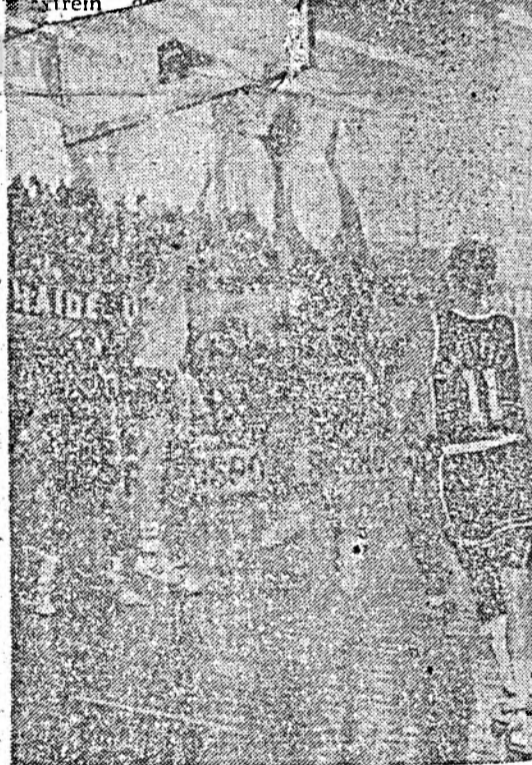
Acțiune sub panoul sibienilor.

• SCHIORT-TRACK Proba nouă, pentru prima oară în programul jocurilor olimpice, întrecerea pe distanța de 1000 m bărbați s-a încheiat cu succesul viteziștii Ki-Noon Kim (Coreea de Sud), care cu timpul de 1:30,76 a stabilit un nou record mondial, cucerind medalia de