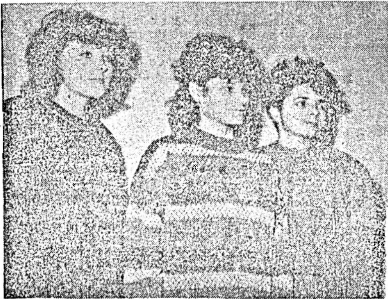
Diversitate de modele de pulovere

Pagină publicitară realizată de: Gh. P. LAZANU, Victor MOREA și I. PETRUȘ