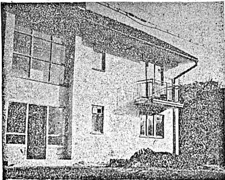
Dispensarul din Chiulești — în paragină.

cal. O clădire întreagă, în care s-au proiectat utilități menite să contribuie la o mai bună asistență medicală a lo-