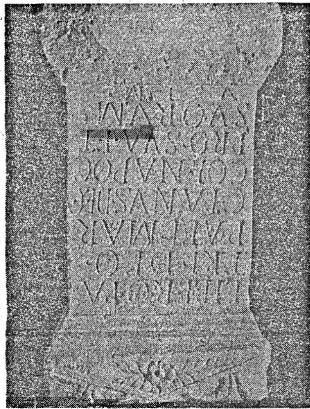
Inscripție lapidară înălțată de decurionul Publius, Aelius Marcianus (sec. II e.n.)