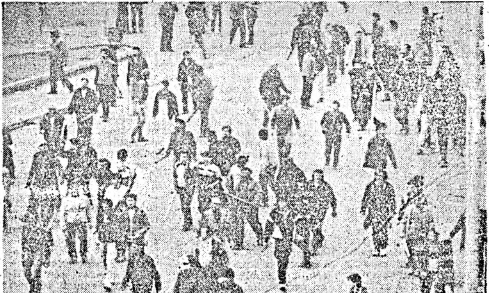
Imagini surprinse în 21 martie la Tîrgu Mureș