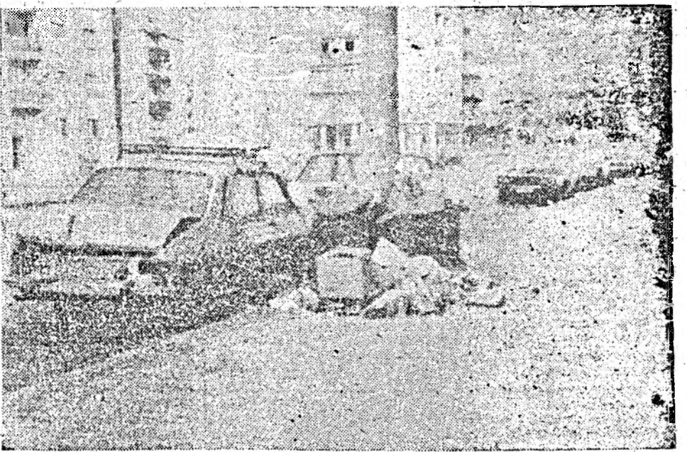
Mașini lăsate în gunoi... gunoaie între mașini. Aspect de pe strada Pata din Cluj

În urma interesului manifestat, ar fi util ca înainte de definitivare modificările intenționate să fie comunicate pentru consultarea opiniei publice.