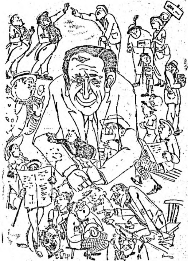
„S-avem pardon"... Desen de BUKŪS Ioan