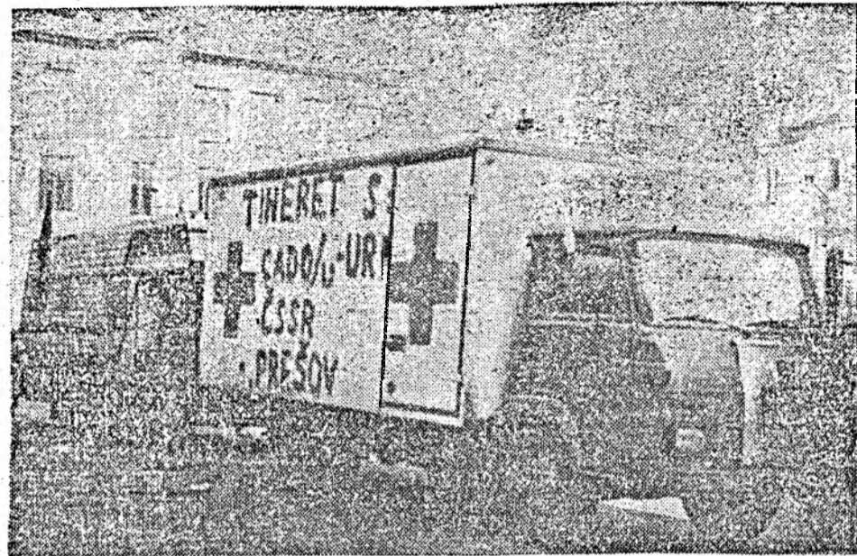
Mai primim, încă, ajutoare, dar ele trebuie să ajungă la destinația celor care le merită și care au nevoie de ele...

● A sosit în Cluj primul transport de nes boabe cu înlocuitori. Anumiți distribuitori le-au și dus acasă, așa cum a procedat și soția unuia care a adunat o grămadă de medicamente străine și soțul ei, suferînd de stomac, a luat niște pilule care s-au dovedit anticoncepționale.