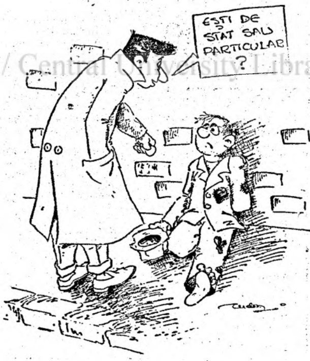
Desen de Tudor BALAN