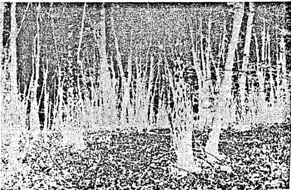
Pădure dragă, pădure...