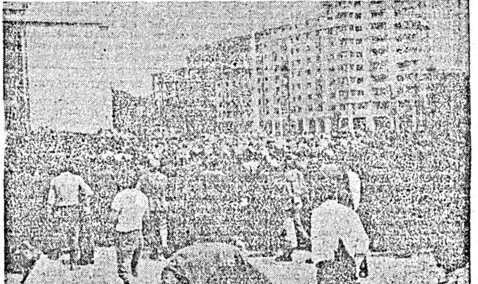
Și totuși, minerii nu aveau ce căuta aici