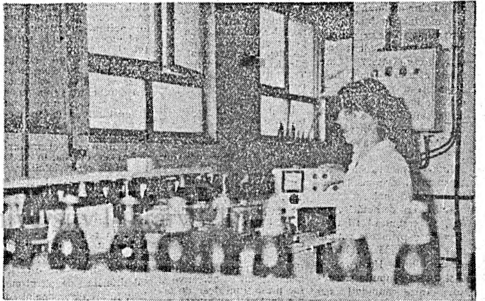
Un fluviu de bere în sticle...

Berea continuă să fie unul dintre cele mai căutate produse. Cînd oamenii presupun că urmează a fi adusă bere la "Alimentara", "Gospodina", și restaurante se fac cozi, cumpărătorii se înghesuie cu lăzi și sacose dintre cele mai mari, se ceartă cu vinzătorii, se ceartă între ei etc. Dacă berea vine, cei mai din față au noroc, alții veniți mai tîrziu se întorc acasă cu sticlele goale. În ajun de sărbători, de simbețe libere oamenii se așază la rînd dimineața, în speranța că berea va sosi. Solicitățile erau și sînt, în continuare, în mică măsură satisfăcute.