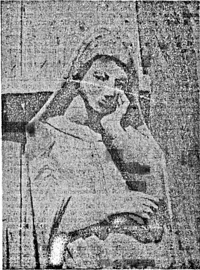
Troița de la Berbești (detaliu)