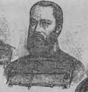
Graf Leiningen Károly