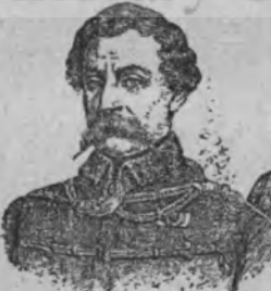
Graf Vécsey Károly