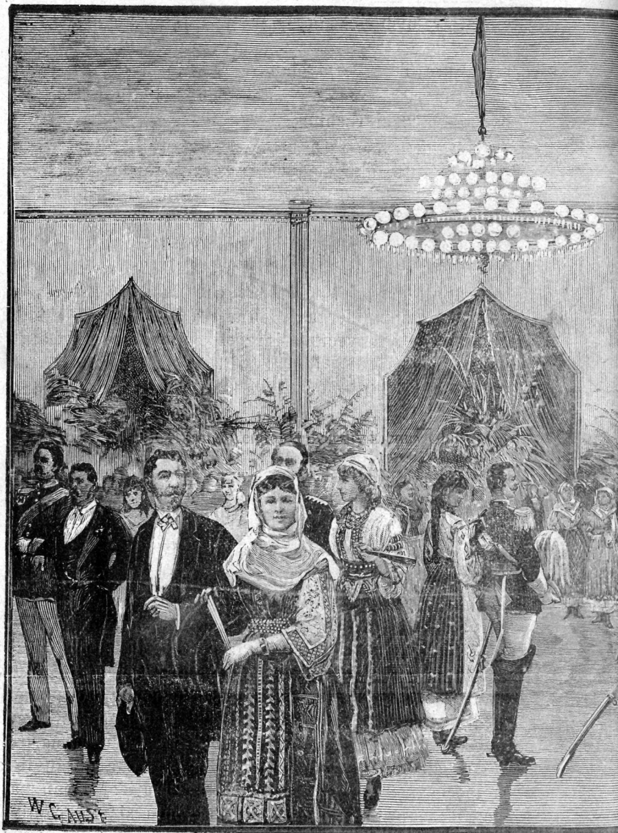
BALU IN SALA TEAT