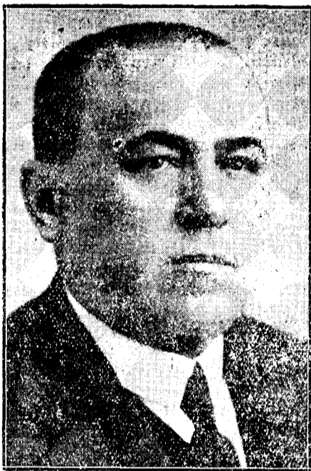
Dr. Emil Hațieganu, vice-președinte al Camerei.

Generația veche a trăit încătușată, umilită, — subjugată. Durerea, suferința strămoșilor trăește în noi. Voi! sunteți o generație fericită, trăiți pe-o glie liberă, și fiind liberă, trebuie să o înfăptuiți așa, precum vreți voi! Generația bătrânilor a fost generația luptelor, căci nu a avut posibilitatea de-a duce la îndeplinire, de-a săvârși tot ceace a fost în sufltele lor. Voi puteți săvârși ceace aveți în sufletul vostru; trebuie, să aveți datoria de a săvârși așa precum credeți mai bine. Aveți datoria de-a controla! Ochii vii ai țării voi sunteți! Voi trebuie să înduplecați voința celor cari, după crezul vostru greșesc, binelui acestei țări căci pentru voi am îndurat noi, pentru voi am înfăptuit țara aceasta!