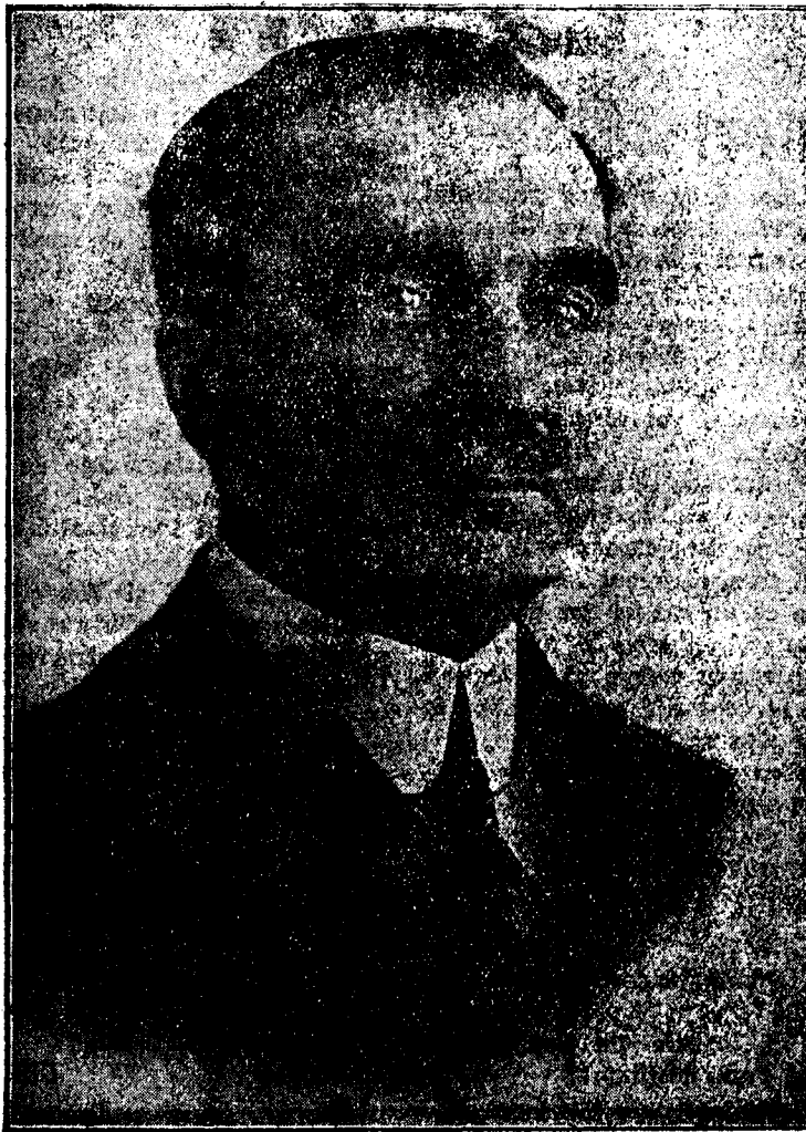
D. IULIU MANIU.

Dar în afară de aceasta a înfăptuit de asemenea și organizarea pe baze sănătoase a vieții financiare a țării noastre, în timp de 13 luni am făcut două bugete echilibrate după un dezastru economic și financiar pricinuit de guvernele liberale și averescane. Cel dintâi de sine înțeles sub povara unui deficit de 5 miliarde lăsat de guvernarea liberală trebuia făcut numai în câteva săptămâni, nu a putut deci oglindi gândirea noastră politică. Cel de al doilea o reglîndește. Cu durere nu o putem înfăptui în întregime din cauza că am găsit în ultimele luni un deficit de 1 miliard 8 sute de milioane lei ce reprezintă angajamente făcute fără acoperire. Vă pu-